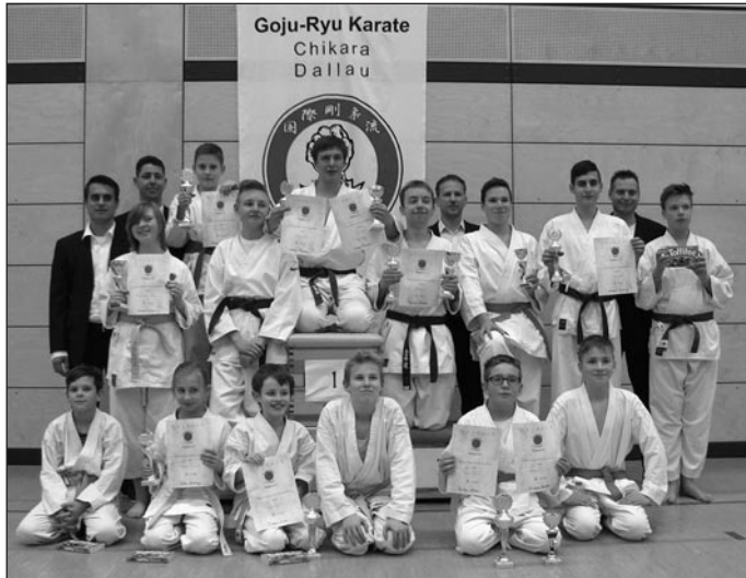
Das Bild zeigt die Sieger und Platzierten zusammen mit den Kampfrichtern.