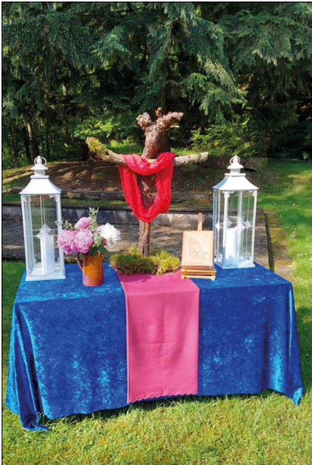
Bild: Jürgen Wolf Das Bild zeigt den Altar beim Pfingstgottesdienst 2024

Die evangelische und katholische Kirchengemeinde Dallau laden am Pfingstmontag, 09.06.2025 um 10.30 Uhr zum ökumenischen Gottesdienst ein. Sofern das Wetter gut ist, treffen wir uns an der Herrlich Au für den Gottesdienst im Freien. Im Anschluss wollen wir bei einem Grillfest noch zusammenbleiben. Bitte bringen Sie Speisen, Getränke und Geschirr für sich mit. Ein Grill steht zur Verfügung. Ein Shuttle-Service vom Parkplatz Trienzbachtal (Märchen-Paul) wird zur Verfügung stehen. Bei schlechtem Wetter findet der Gottesdienst in der katholischen Kirche in Dallau statt. Dann muss das Grillen leider ausfallen. Sollten wir in die Kirche ausweichen müssen, werden um 9.30 Uhr die Glocken beider Kirchen läuten! Wir freuen uns auf zahlreiche Gäste!