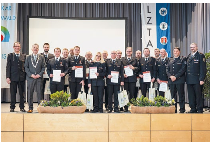
Ehrung der Feuerwehrleute.