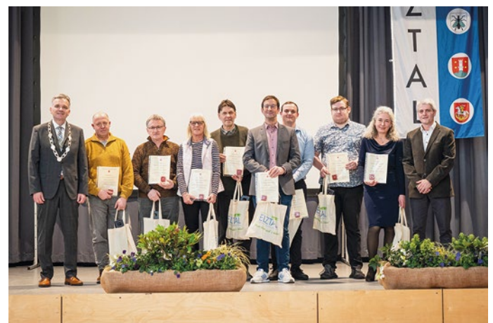
Ehrung der Blutspender/-innen.