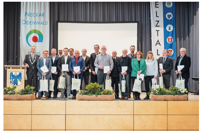
Ehrung der Kommunalpolitiker/-innen.