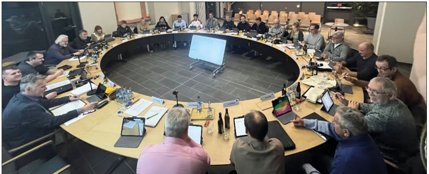
Sitzung des Elztaler Gemeinderats vom 18. 11. 2024

Um die Nutzung des Ratsinformationssystems für die Gemeinderäte noch effizienter zu gestalten, wurden allen Mitgliedern des Gemeinderats Tablets zur Verfügung gestellt. Diese ermöglichen es den Ratsmitgliedern während der Sitzungen schnell auf alle relevanten Dokumente zuzugreifen, ohne auf Papierdokumente angewiesen zu sein. Ebenso können die Unterlagen vor einer Sitzung individuell von den Gemeinderäten aufbereitet und vorbereitet werden. Auch der Austausch unter den Mitgliedern oder Rückfragen bei Bürgermeister und Verwaltung lassen sich so einfacher durchführen. So wird nicht nur die Arbeit im Rat effizienter, sondern gleichzeitig auch der Papierverbrauch deutlich reduziert.