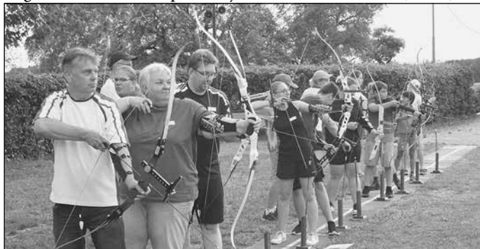
Anfängerkurs, erste Pfeile

Bogenschießen ist ein Sport für jedes Alter, traut Euch!! (GüVo)