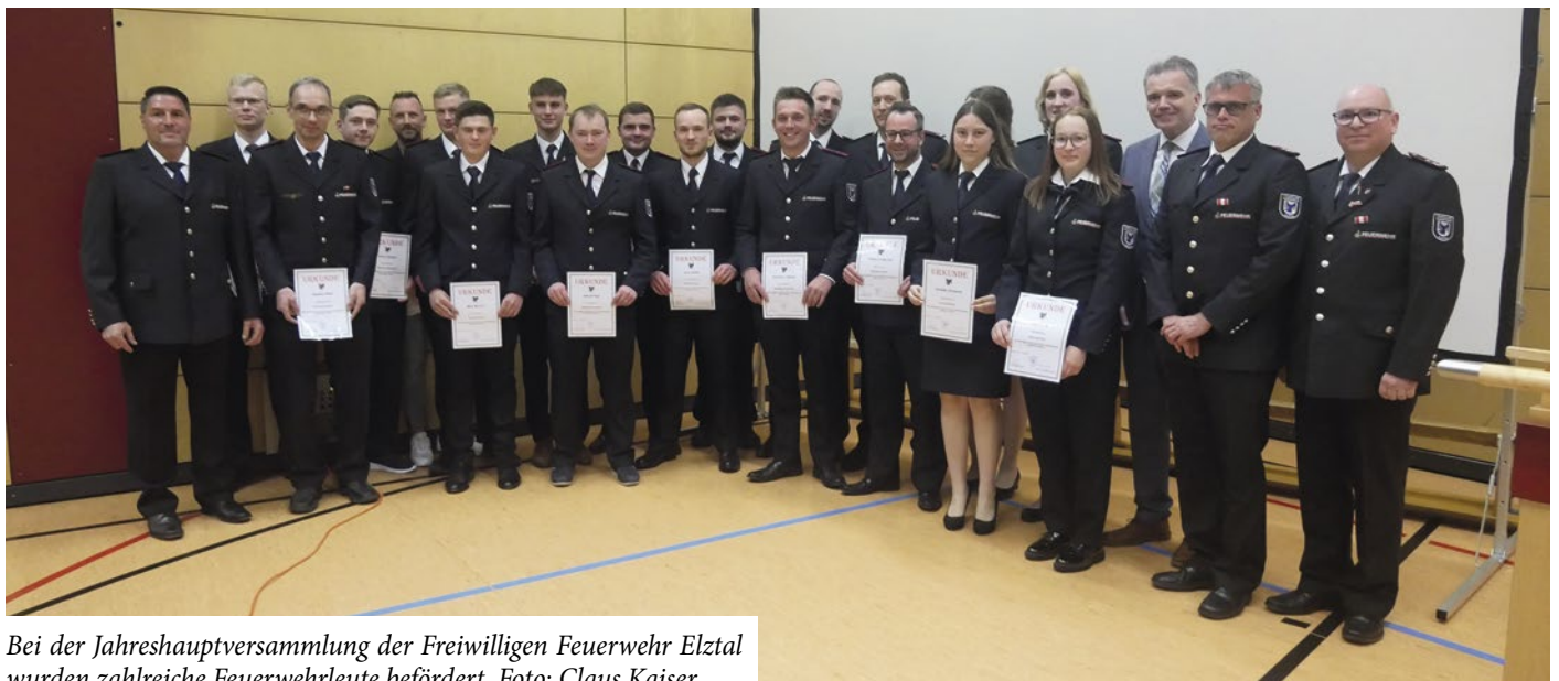
Bei der Jahreshauptversammlung der Freiwilligen Feuerwehr Elztal wurden zahlreiche Feuerwehrleute befördert.

Die Einsatz-Abteilungen hatten im abgelaufenen Jahr 47 Einsätze abzuarbeiten. Die Einsatzzahl sei erneut gestiegen und es seien wieder einige herausfordernde Einsätze dabei gewesen, auf die der Ge-