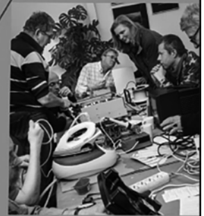
Hilfe beim Reparieren

Was macht man mit einem Toaster, der nicht mehr funktioniert? Oder mit einem Pullover mit Löchern? Wegwerfen? Denkste!