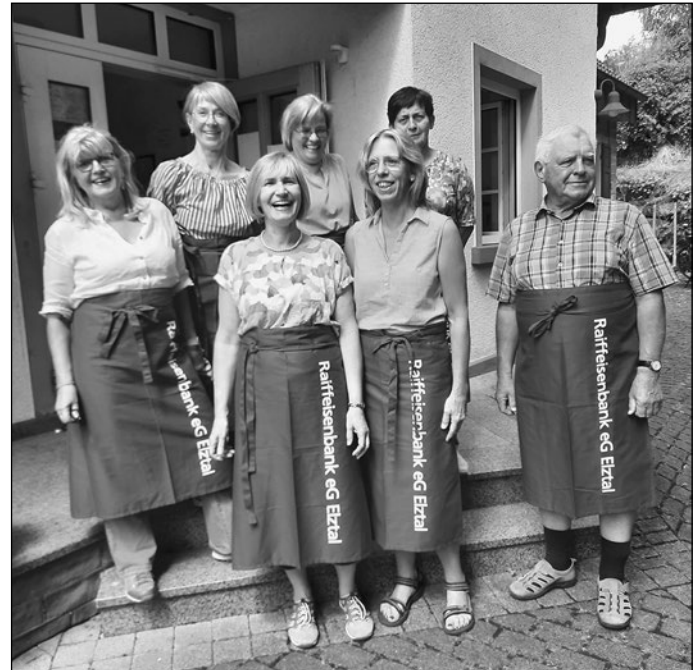
Die Vorstandschaft Förderverein für das Ev. Gemeindehaus Auerbach

Besuch und Ihre großzügige Unterstützung! Bedanken möchten wir uns auch für die Kuchenspenden und für alle Hilfe beim Auf- und Abbau sowie der Durchführung. Ein ganz besonderer Dank geht an die Freiwillige Feuerwehr Auerbach, die uns Festzeltgarnituren und Kühlschrank zur Verfügung gestellt hat und später auch noch in nachbarschaftlicher Verbundenheit mit fehlenden Rohstoffen aus-helfen konnte.