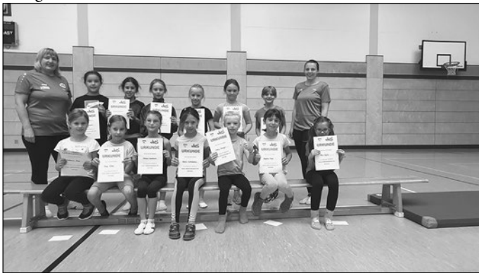
Das rechte Bild zeigt die 7- bis 9-jährigen Mädchen.

Alle Kinder waren ganz fleißig dabei und freuten sich am Ende über die Urkunden, die mit viel Applaus der Eltern an jedes Turnkind übergeben wurde.