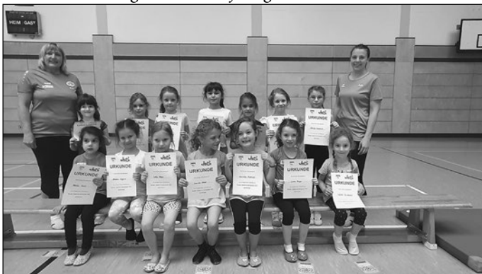
Das linke Bild zeigt die 4- bis 6-jährigen.