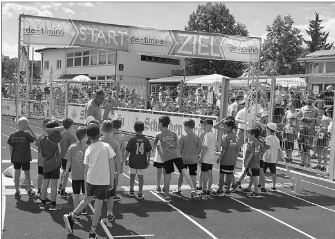
Die Einzelergebnisse der Sparkassen Schülerläufe:

Auch die beliebte Schulwertung, welche Schule die prozentual meisten „Finisher“ bezogen auf die Gesamtschülerzahl hat, fand dieses Jahr wieder den Weg ins Programm. Hier gewann die Kurfürstin-Amalia-Grundschule Lohrbach mit (63,8%) vor der Wilhelm-Stern-Schule mit 33,8 % und der Waldsteige Grundschule mit 31,5 %.