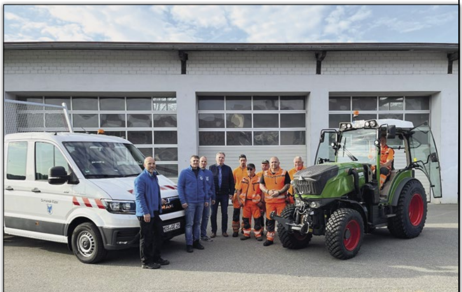
Bürgermeister, Bauamtsleitung sowie der Bauhofleiter und sein Team freuen sich über die neuen Fahrzeuge und die Arbeitserleichterung.

Im April konnte man dann nach langem warten, den neuen Schmalspurschlepper von der ZG Technik in Mosbach abholen. Nach 23 Jahren Dienst war es an der Zeit, den in die Jahre gekommenen Vorgänger durch ein wirtschaftlicheres Fahrzeug zu ersetzen. Mit einem Anschaffungspreis inkl. Winterausrüstung von 151.000 Euro ist der mit 91 PS ausgestattete Schmalspurschlepper keine unwesentliche Investition. Mit dem neuen Schlepper kann der Bauhof seine Arbeiten auf den Sportplätzen, Straßen, in Feld und Flur wieder effizient verrichten.