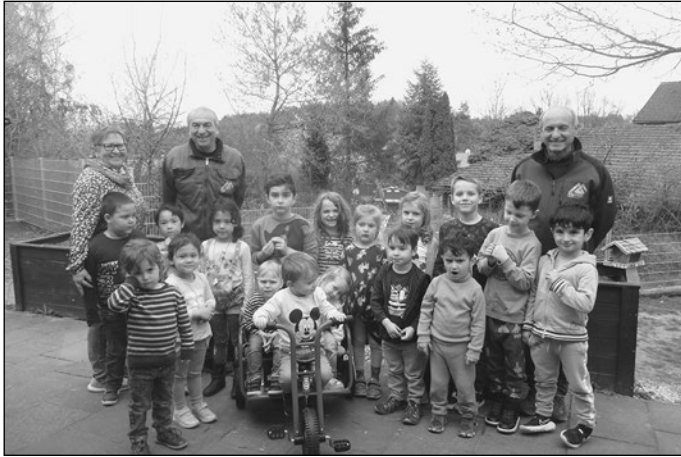
Kinder und Mitarbeiter des Kindergarten St. Josef

bereich anschaffen! Wir bedanken uns ganz herzlich bei der Firma Mackmull und bei unseren Eltern des Kindergartens für die tolle Bereicherung unserer Spielgeräte!