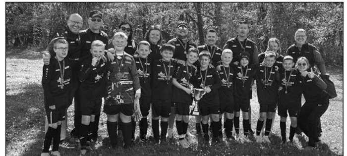
Team, Trainer und Betreuer