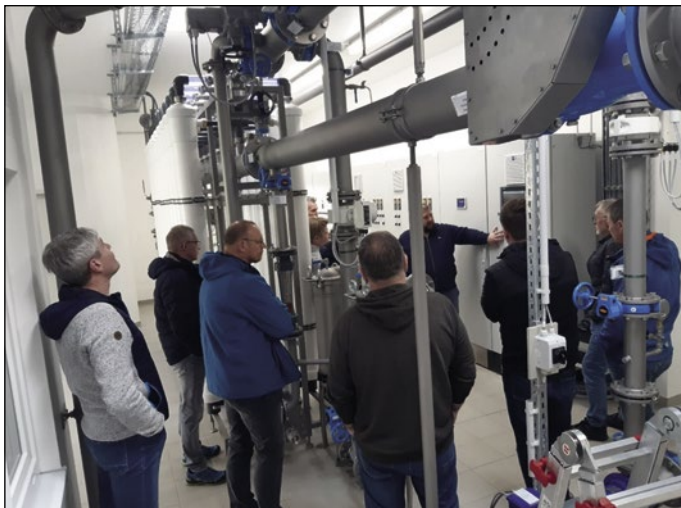
Die Ultrafiltrationsanlage – ein wesentlicher Teil der Wasserversorgung.