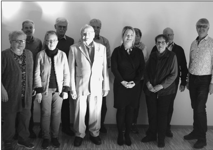
Die neu gewählte Vorstandschaft.