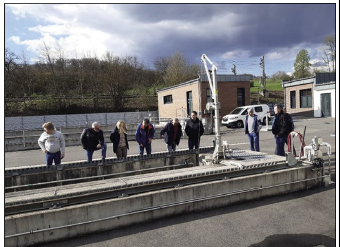
Kläranlage Neckarburken – Hohe technische Anforderung für eine sichere Abwasserbehandlung.