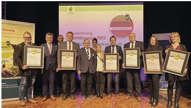
Die Vertreter der Kommunen, der TGO und des Landkreises bei der Auszeichnung.

Dieser Tage wurde auf der Caravan-Motor-Touristik (CMT) Publikumsmesse in Stuttgart der Elztaler Römerpfad, die „Minervatour“ als Traumwanderweg der „Qualitätswege Wanderbares Deutschland“ ausgezeichnet. Neben dem Elztaler Wanderweg, der vom Bahnhof in Neckarburken durch den Neckarburkener Wald und das Trienzbachtal nach Dallau führt, erhielten auch die anderen fünf Römerpfade im Geschäftsbereich der Touristikgemeinschaft Odenwald diese Auszeichnung. Die gemeinsam konzipierten Wanderwege mussten sich dabei einer anspruchsvollen Prüfung des Deutschen Wanderverbandes stellen. Die sechs Römerpfade in unserer Region bieten spannende Tagestouren. Wanderer können dabei die römische und germanische Geschichte erleben. Zudem bieten die Wege zahlreiche Informationen rund um den Limes.