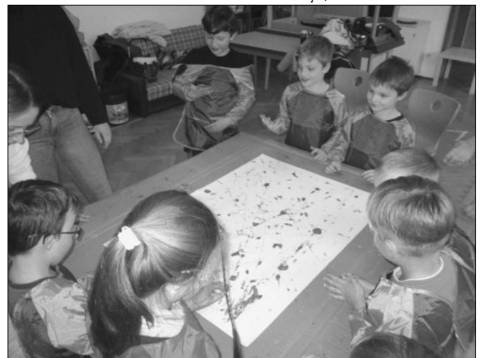
1. Übung mit Kenntnislernspiel