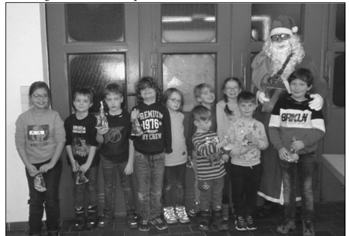
Besuch des Nikolauses