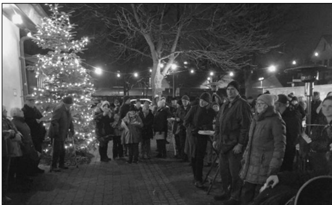
Der Adventsabend am 3. Advent.