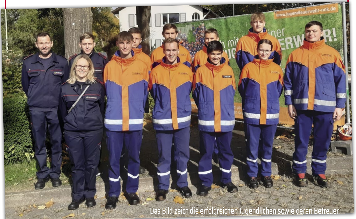
Das Bild zeigt die erfolgreichen Jugendlichen sowie deren Betreuer