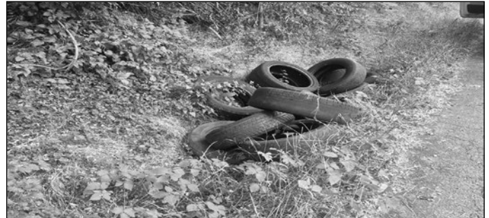
Ablagerung von ca. 15 Altreifen im Gewann Dillstal auf Gemarkung Auerbach.