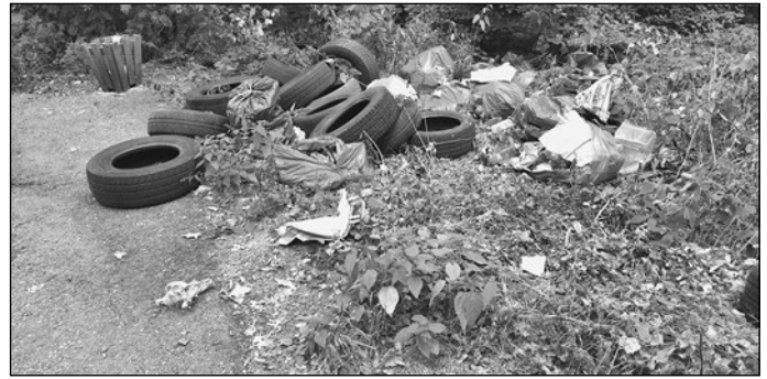
Parkplatz – Abzweig Anbindung Trieb, OT Auerbach (Altreifen – ca. 15 Stück und Hausmüll).

In den vergangenen Wochen kam es wieder vermehrt zu Fällen von unerlaubter Müllentsorgung auf Feld- und Waldflächen unseres Gemeindegebietes. Neben Hausmüll werden auch immer wieder Altreifen wild in der Natur abgeladen. In einem konkreten Fall wurden insgesamt ca. 50 Altreifen im Bereich Grüngutplatz abgelegt. Die Polizei wurde bereits eingeschaltet. Wir bitten die Bevölkerung um sachdienliche Hinweise, falls Sie Beobachtungen zu diesem Fall gemacht und Angaben zur Entsorgung machen können. Bitte wenden Sie sich in diesem Fall umgehend an das Ordnungsamt der Gemeinde Elztal, Tel. 06261/8903-16. Vergehen dieser Art werden sofort zur Anzeige gebracht , damit auch die entstehenden Kosten nicht zu Lasten der Allgemeinheit gehen und dem konkreten Verursacher zugewiesen werden können.