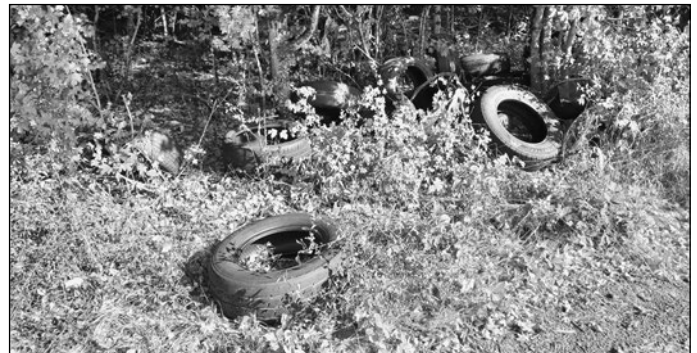
Erneute Müllablagerungen im Bereich Grüngutplatz, es wurden ca. 50 Altreifen abgelagert.