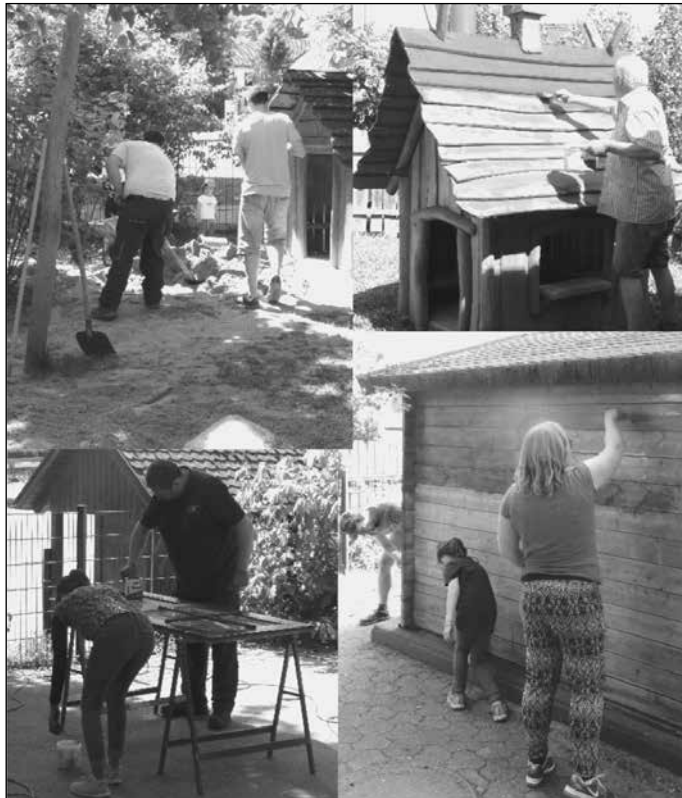
Erzieherinnen vom Ev. Kindergarten Neckarburken

Wir Erzieherinnen, und vor allem die Kinder bedanken sich bei allen Helfern, für Ihren unermüdlichen Einsatz.