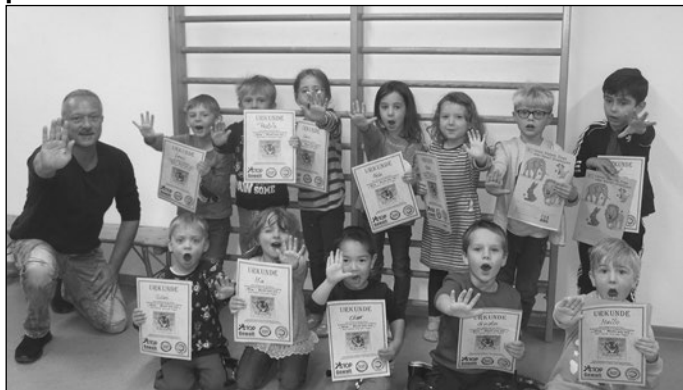
Kinder und Mitarbeiter aus dem Muckentaler Kindergarten

Am Mittwoch, den 13. Oktober 2021, fand im Muckentaler Kindergarten am Vormittag für alle Schulanfänger 2022 und 2023 eine gemeinsame Veranstaltung mit dem Bundesverband Gewaltprävention e.V. statt! Zum Thema „Kinder stark machen!“ wurden spielerisch in verschiedenen Übungen das Selbstbewusstsein der Kids