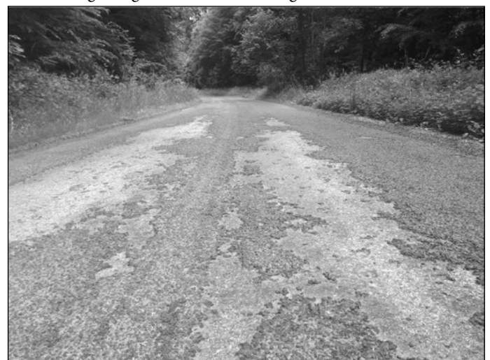
Vor den Arbeiten ...

geringe Einbaukosten, geringe Lärmbelästigung, geringe Verkehrsbehinderung, rasche Freigabe für den Verkehr, Ressourcenschonung und Überbaubarkeit. Dünne Schichten im Kalteinbau sind eine kostengünstige und schnelle Lösung.