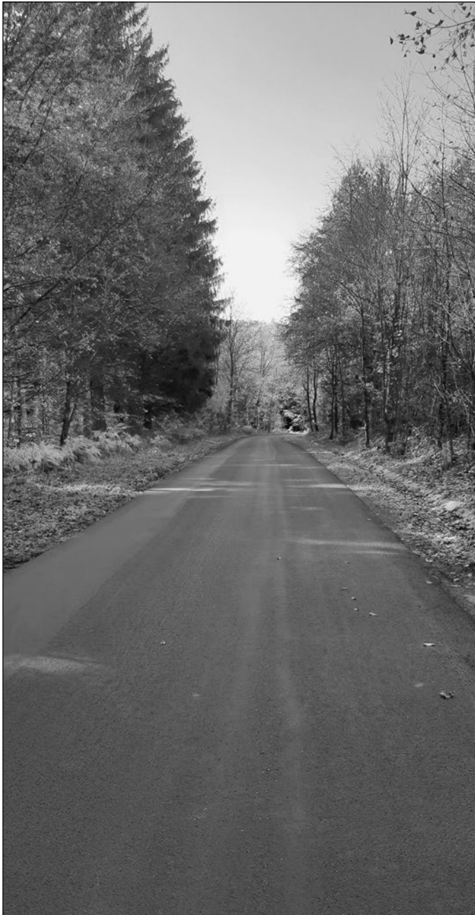
... nach den Arbeiten