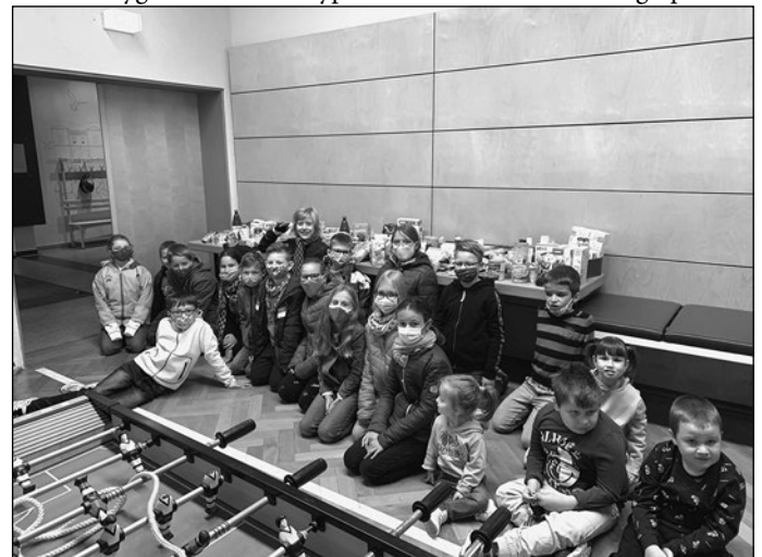
Verfasst von Maja Klingner

Da die Klassen möchten, dass es diesen Menschen etwas besser geht wurden Hygieneartikel, Babyprodukte und Lebensmittel gespendet.