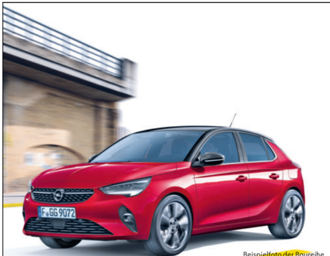
Beispielfoto der Baureihe. Ausstattungsmerkmale ggf. nicht Bestandteil des Angebots.