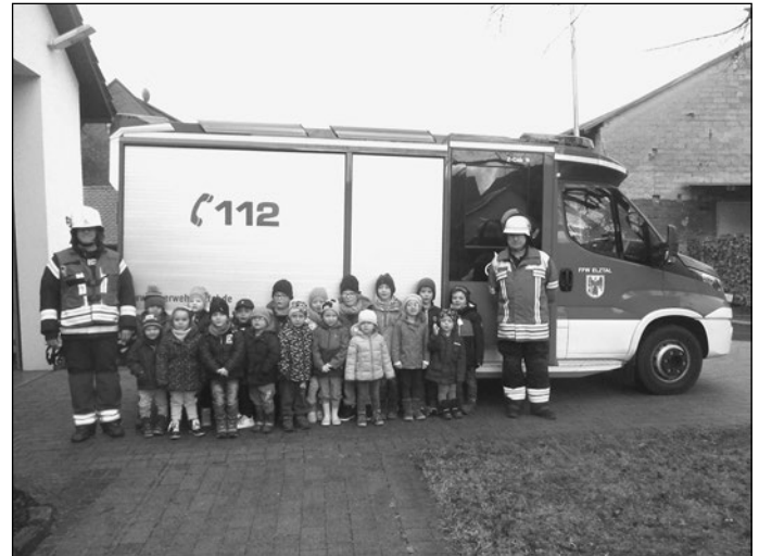
Kinder und Erzieher aus dem Muckentaler Kindergarten

Ganz lieben Dank nochmals besonders an die beiden Feuerwehrkameraden Hemberger und Haaf für die Einladung – es hat uns allen viel Spaß bereitet!