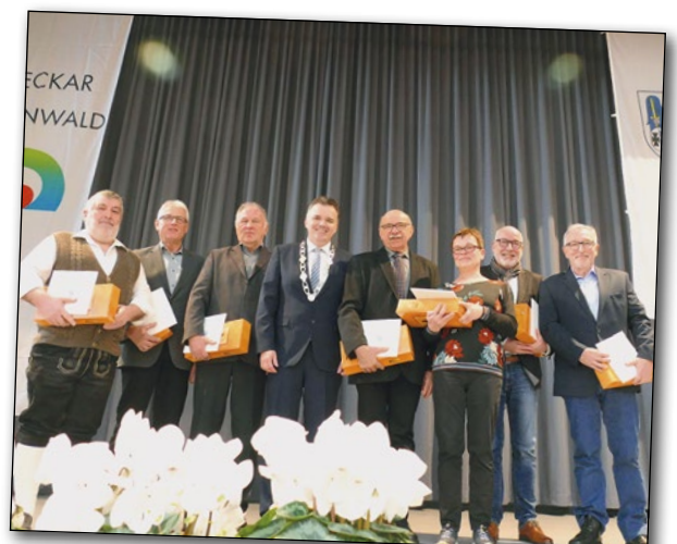
Geehrte Gemeinde- und Ortschaftsräte der Gemeinde Elztal