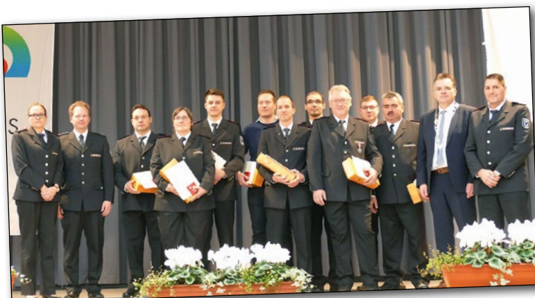
Geehrte Feuerwehrleute der Gemeinde Elztal