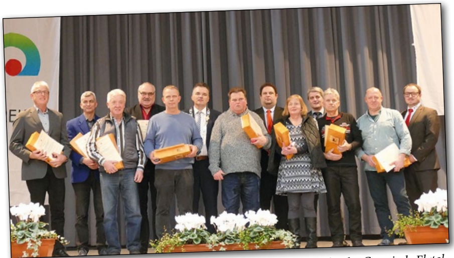
Geehrte Blutspender der Gemeinde Elztal